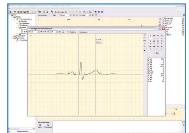
Контурный анализ ЭКГ. Окно измерения кардиокомплекса